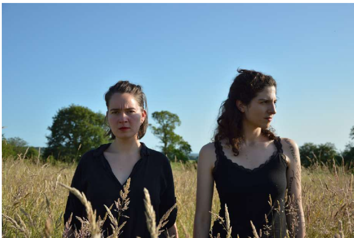
Normandie, juillet 2020, photo : Timothée Fels

compagnie B.A.L - Bold As Love association loi 1901 - créée en mars 2019 39 avenue du 6 juin 14000 Caen