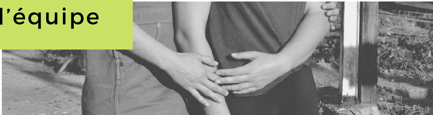
Delhia Dufils, Photo de répétition, Le Lieu Commun, Vire, septembre 2020