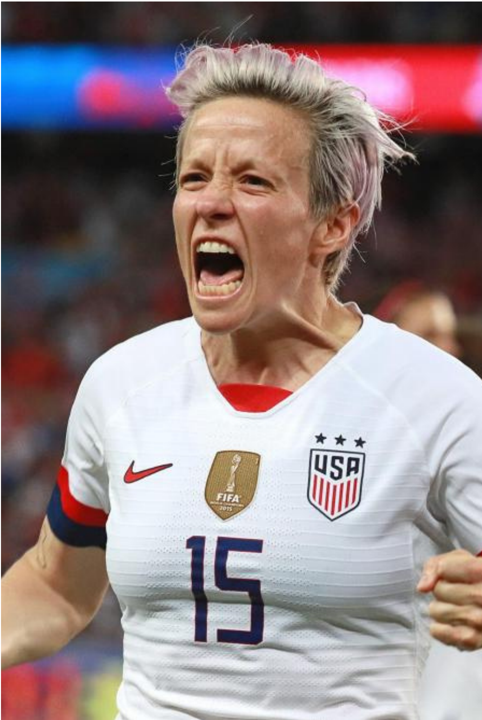
Megan Rapinoe - Coupe de monde de football féminin - Paris, 2018

Création tout public - à partir de 13 ans 2024