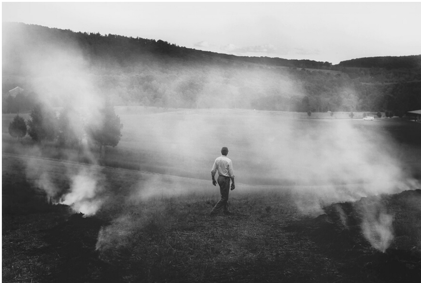
The Turn © Sally Mann